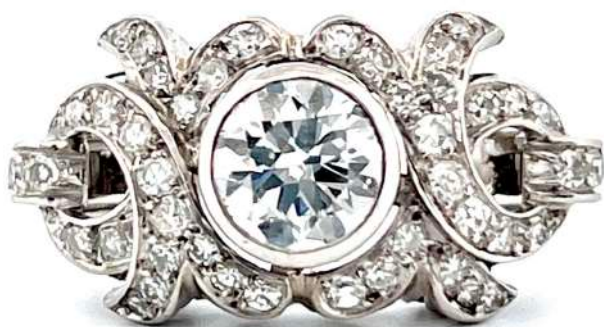
Pierścionek z diamentami

Pierścionek w stylu Art deco z centralnym diamentem w starym szlifie brylantowym o masie ~1 ct i diamentami w starych szlifach o łącznej masie ~0,60 ct