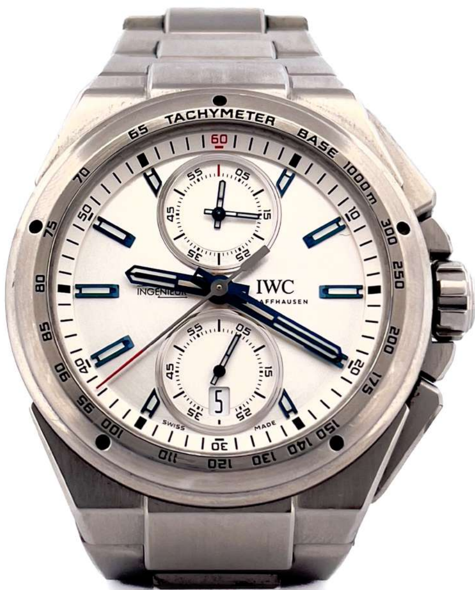
IWC Ingenieur Chronograph Racer

IW378510, koperta stalowa 45 mm, naciąg automatyczny