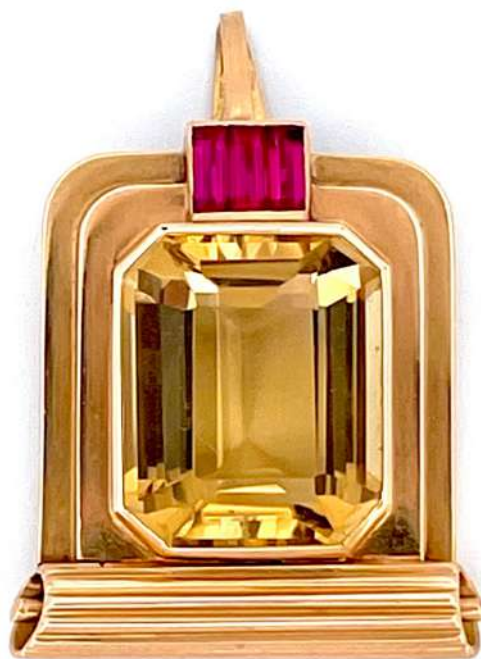
Zawieszka z różowego złota z cytrynem i rubinami.