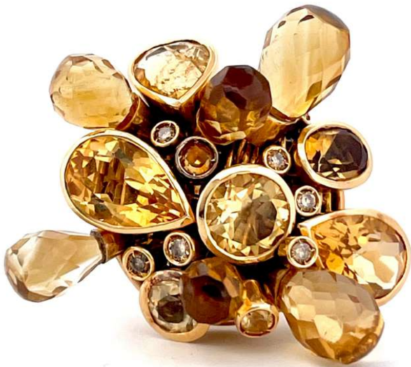
Pierścionek z cytrynami