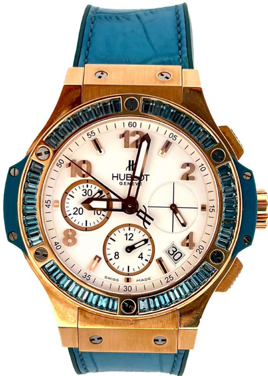
Hublot Big Bang Tutti Frutti Chronograph

Ref. 341.PL.2010.LR.1907, koperta z różowego złota z lunetą wykładaną topazami 41 mm, mechanizm automatyczny z funkcją chronografu.