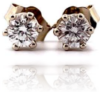
Kolczyki z diamentami

Naszyjnik z białego złota z diamentem o masie ~0,49 ct