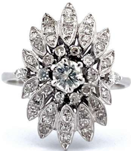
Pierścionek z diamentami

Pierścionek z 18-karatowego białego złota z diamentami w szlifie brylantowym