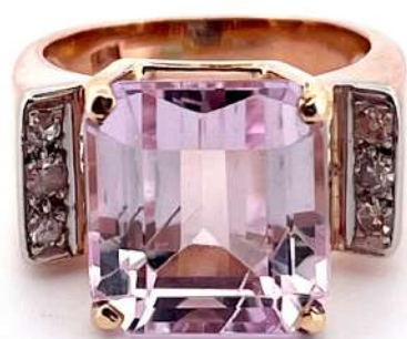
Pierścionek z kunzytem i diamentami.

Pierścionek z 18-karatowego złota z kunzytem i diamentami w starym szlifie brylantowym.