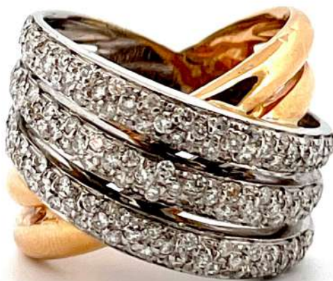
Pierścionek z diamentami

Pierścionek z złotego i białego 18-karatowego złota z diamentami.