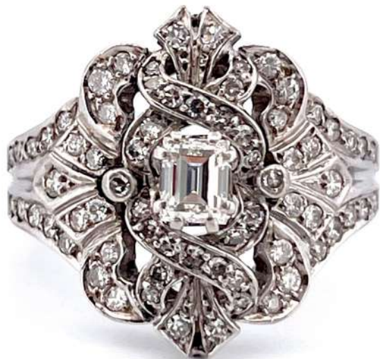
Pierścionek z diamentami

Pierścionek z 18-karatowego białego złota z diamentami w szlifach brylantowym i bagietowym