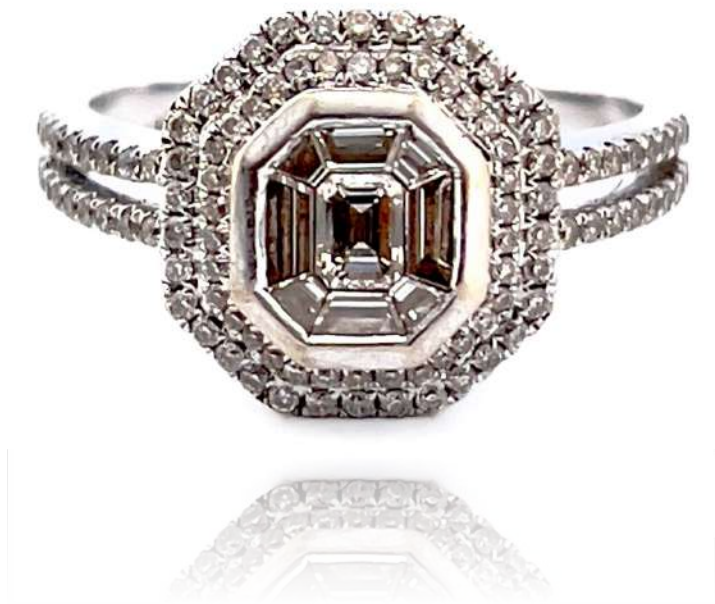
Pierścionek z diamentami