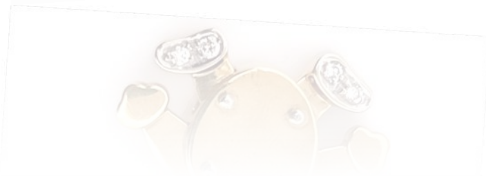
Pierścionek z szafirami

Zawieszka Pomellato z 18-karatowego złota z diamentami