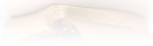
Pierścionek diamentami i rubinami