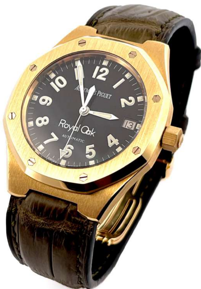
Audemars Piguet Royal Oak

Ref. 14800BA.OO.D080VS.01, koperta z żółtego złota 36 mm, mechanizm automatyczny