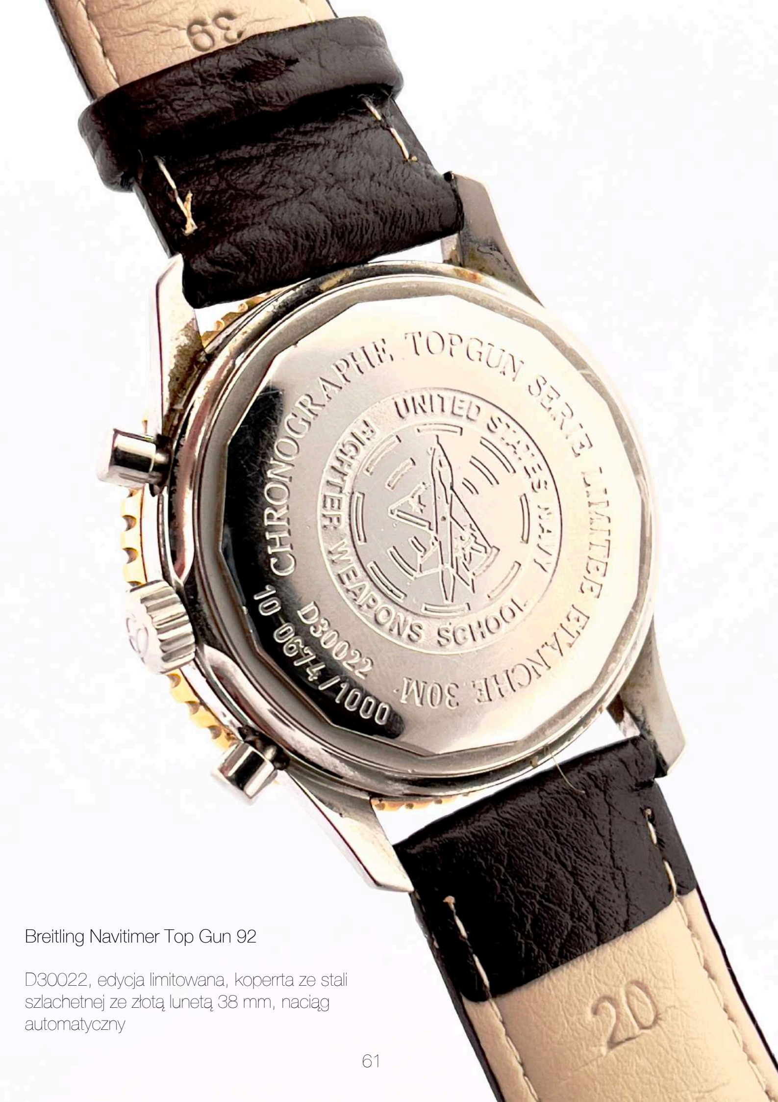
Breitling Navitimer Top Gun 92

D30022, edycja limitowana, koperta ze stali szlachetnej ze złotą lunetą 38 mm, naciąg automatyczny