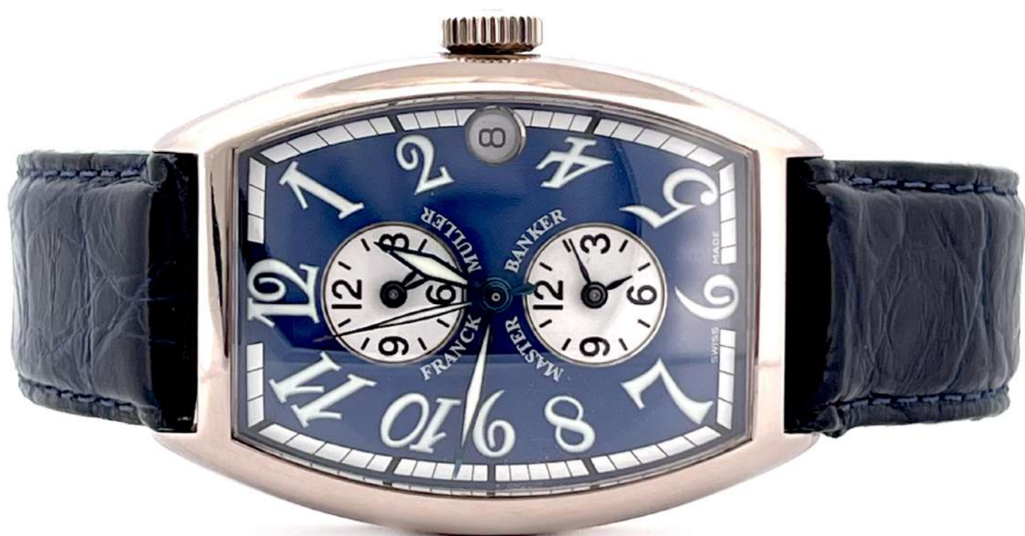
Franck Muller Master Banker

Ref. 6850MB, koperta z białego 18-karatowego złota, funkcja 3 stref czasowych.