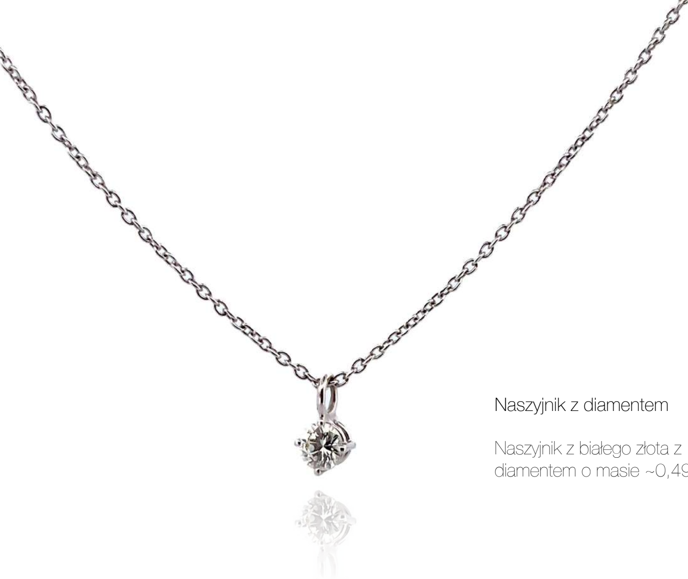
Naszyjnik z diamentem

Naszyjnik z białego złota z diamentem o masie ~0,49 ct