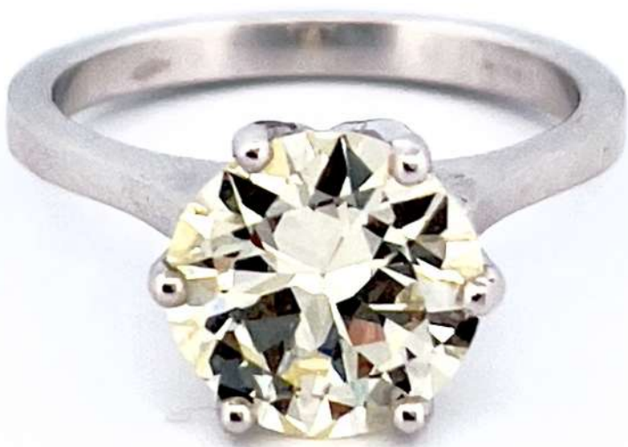
Pierścionek z diamentem

Pierścionek z białego 18-karatowego złota z diamentem o masie ~3,24 ct