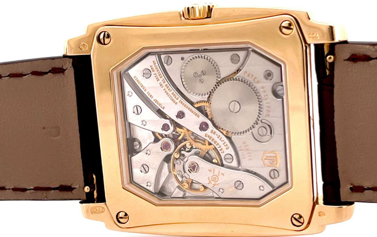
Zegarek Patek Philippe Gondolo

Ref. 5124J koperta z złotego 18 karatowego złota, mechanizm z naciąganiem manualnym