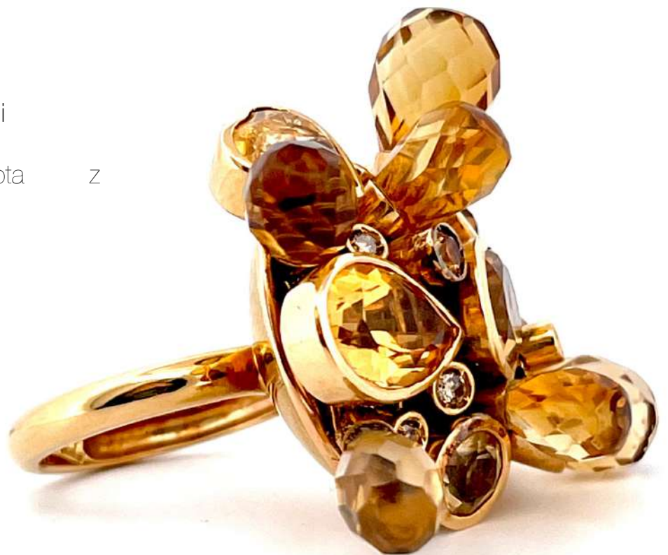
Pierścionek z żółtego złota z cytrynami