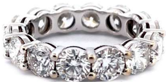
Pierścionek z diamentami

Obrączka wykonana z białego 18-karatowego złota z diamentami o szlifie bagietowym o łącznej masie ~1,40 ct