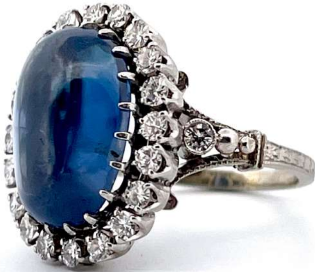
Pierścionek z szafirem i diamentami

Pierścionek z białego 18- karatowego złota z szafirem w szlifie kaboszonowym i diamentami w starym szlifie brylantowym.