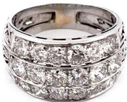
Pierścionek z diamentami

Pierścionek z 18-karatowego białego złota z diamentami w szlifie brylantowym o łącznej masie ~ 1,80 ct