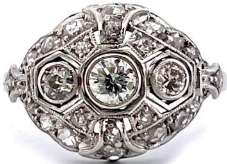
Pierścionek z diamentami

Pierścionek z 18-karatowego białego złota z diamentami w szlifie brylantowym