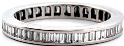
Pierścionek z diamentami

Obrączka wykonana z białego 18-karatowego złota z diamentami o szlifie bagietowym o łącznej masie ~1,40 ct