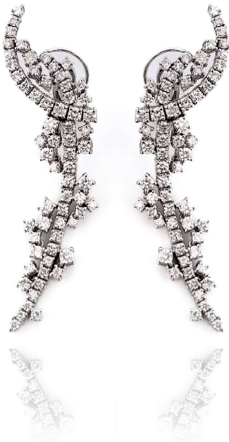
Kolczyki z diamentami

Kolczyki z 18-karatowego białego złota z diamentami w szlifie brylantowym o łącznej masie ~4,50 ct.