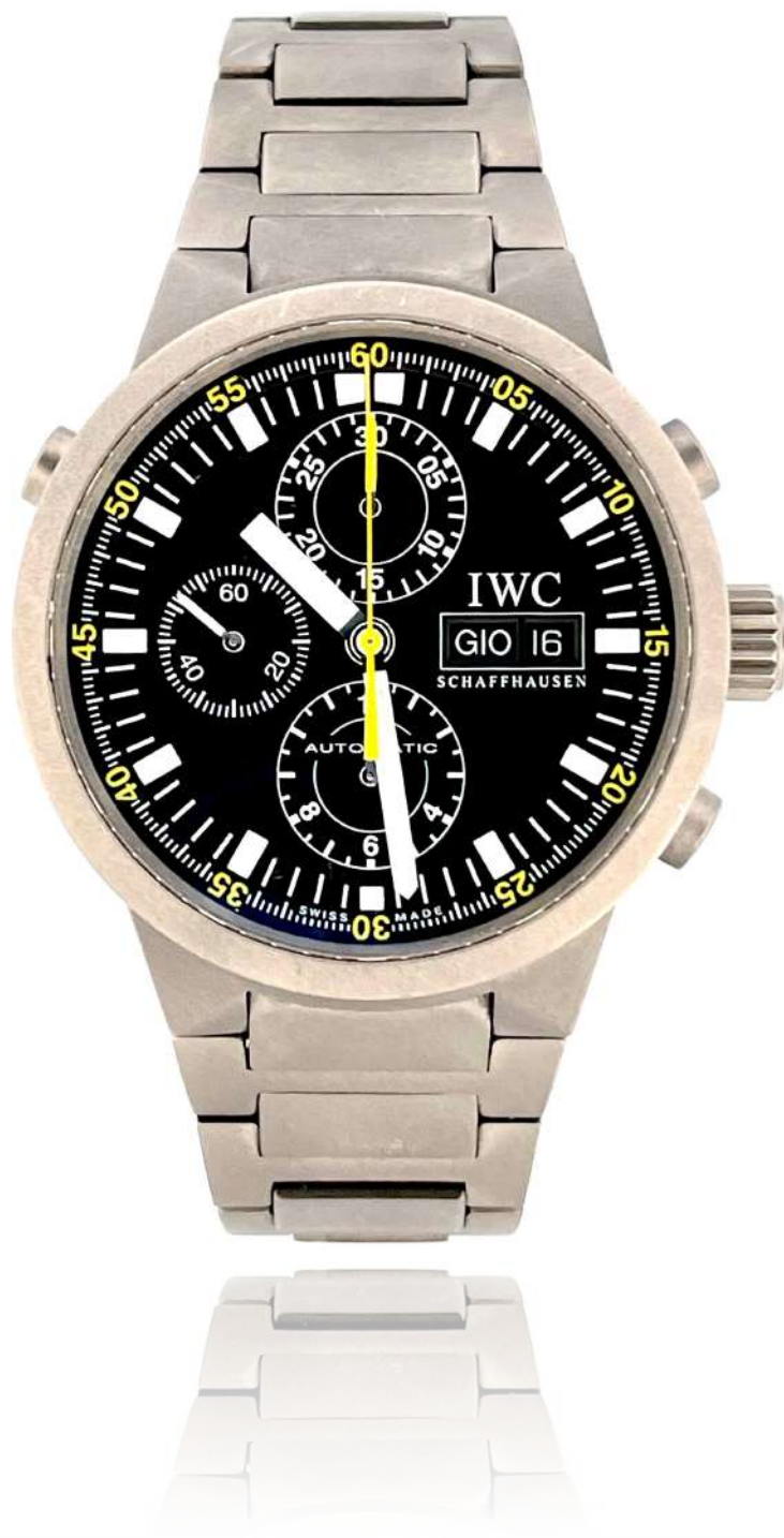
IWC GST Chronograph Rattrapante

W3715, koperta tytanowa 43 mm, funkcja chronografu rattrapante, naciąg automatyczny