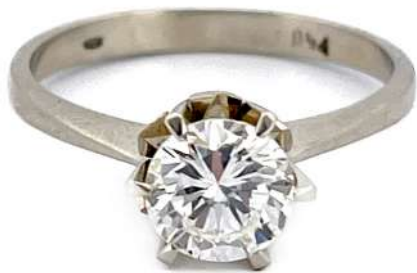
Pierścionek z diamentem

Pierścionek z białego 18-karatowego złota z diamentem o masie ~1,09 ct