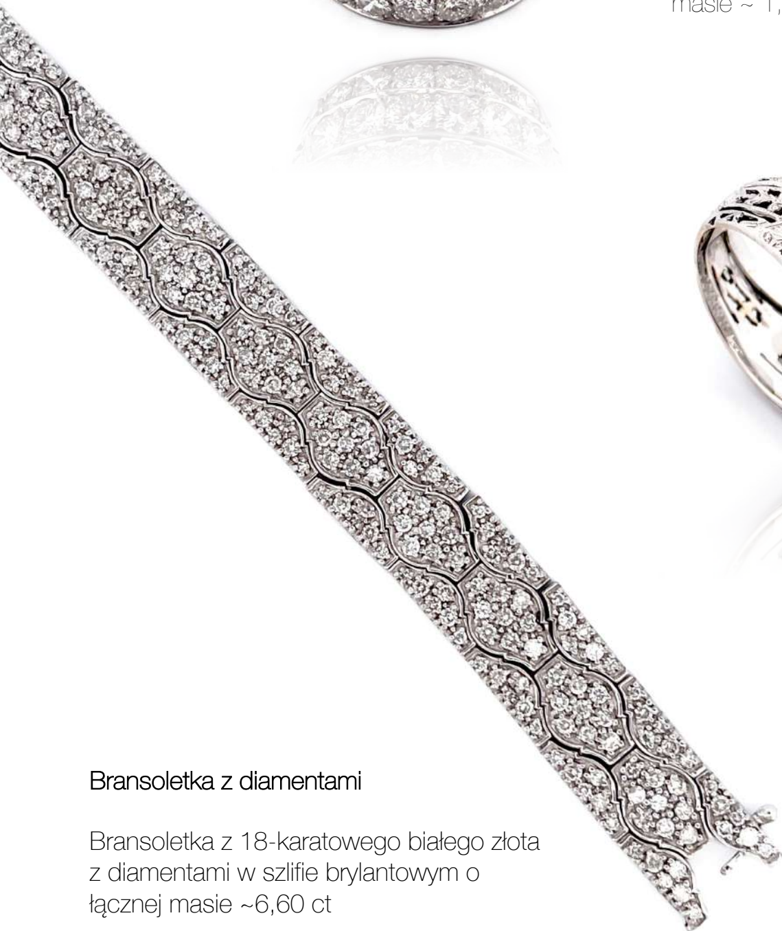
Bransoletka z diamentami

Pierścionek z 18-karatowego białego złota z diamentami w szlifie brylantowym o łącznej masie ~ 1,80 ct