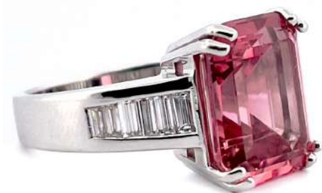
Pierścionek z turmalinem i diamentami

Pierścionek z białego 18-karatowego złota z turmalinem i diamentami w szlifie bagietowym.