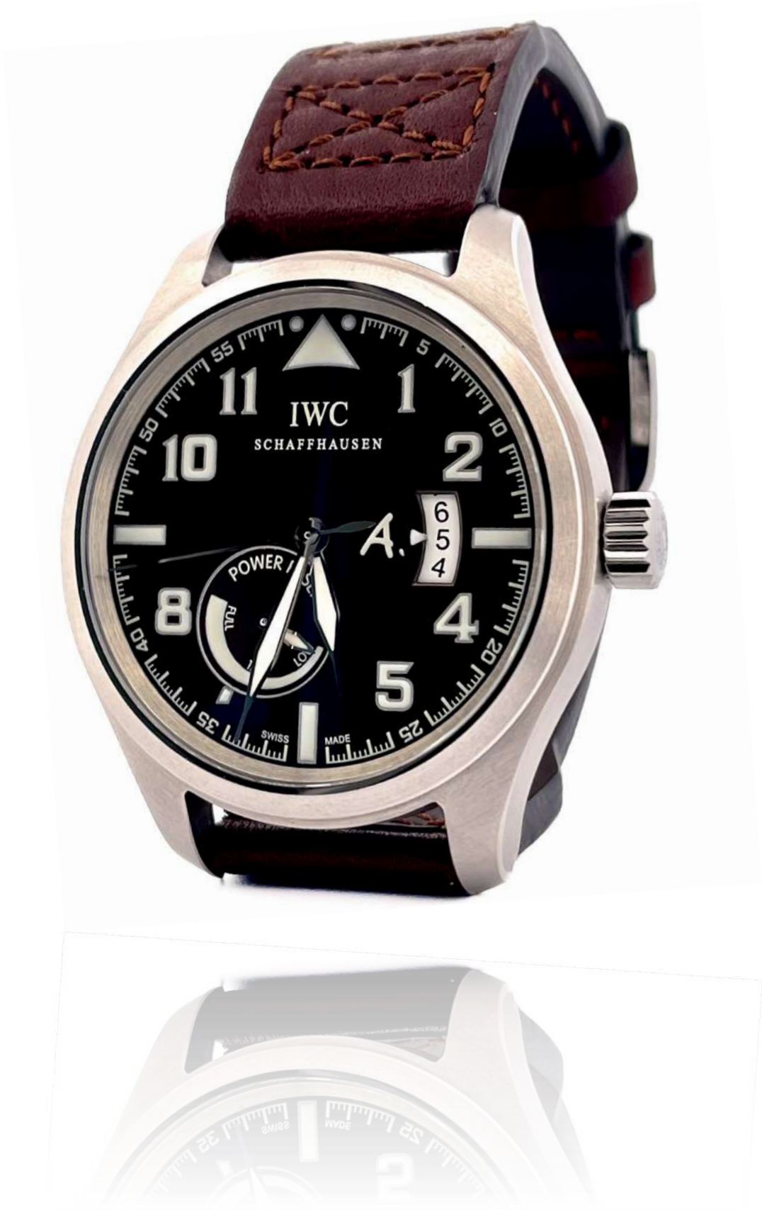
IWC Pilot's Watch Antoin de Saint Exupery

IWC IW320104, edycja limitowana, koperta stalowa 43 mm, naciąg manualny