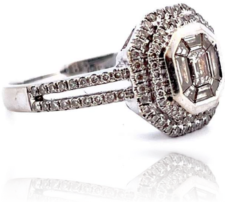
Pierścionek z białego złota z diamentami